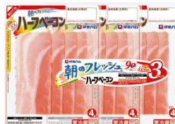
朝のフレッシュ® ハーフベーコン3連