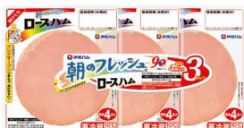
朝のフレッシュ® ロースハム3連