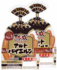
The GRAND アルトバイエルン 127g2B