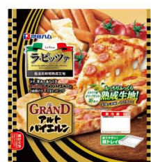
ラ・ピッツァ The GRAND アルトバイエルン